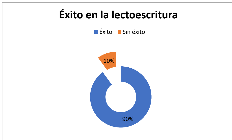
Figura 1. Éxito en la lectoescritura.

Los resultados obtenidos en este estudio sobre las estrategias didácticas para el desarrollo de la lectoescritura en la educación básica media, proporcionaron información valiosa sobre la efectividad de diversas prácticas pedagógicas y su impacto en el nivel de competencia relacionado con la lectoescritura de los estudiantes. Asimismo, estos develaron que, desde la percepción docente y de las observaciones realizadas, la lectoescritura se perfiló como una competencia fundamental para: el éxito, la participación activa, el fomento de una reflexión crítica y el logro de un proceso de enseñanza-aprendizaje dinámico . Seguidamente, se detalla cada aspecto: