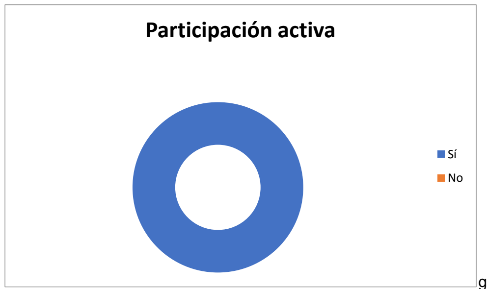
Figura 2. Participación activa.

Para (Hernández et al. , 2015, p. 92). “El desarrollar una clase metodológicamente, permite que ésta sea variada, dinámica, interesante y coadyuva a mejorar el aprendizaje del estudiante y el logro a satisfacción de sus competencias laborales”. En este caso, los docentes diseñaron actividades y recursos teniendo en cuenta los intereses, la cultura y el nivel de competencia de sus estudiantes, obteniendo de esta manera, mejores resultados en el desarrollo de la lectoescritura, lo cual les servirá de base para su desempeño en un futuro como profesionales.