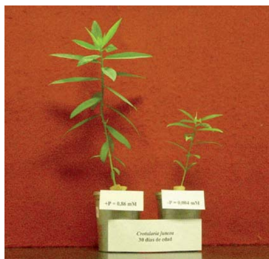
FIGURA 1. Plantas de Crotalaria juncea L. de 30 d de edad, obtenidas bajo suficiencia (izquierda) y deficiencia de fósforo (derecha).

En la Figura 1 se observa el aspecto general de las plantas de Crotalaria juncea L. de 30 d de edad, obtenidas bajo deficiencia y suficiencia de P. El efecto de la deficiencia sobre Crotalaria se manifestó por una baja acumulación del biomasa seca total de las plantas, pero el parámetro más afectado fue el ÁF, con reducciones de 60,5% y 61,3% a los 25 y 30 d de edad (Cuadro 1). Grandes reducciones para el ÁF fueron encontradas por Cordero et al. (2005) y Oosterhuis et al. (2008) en C. spectabilis y Gossypium hirsutum , así como en plantas como Ruellia Tuberosa , Euphorbia heterophylla (Ascencio y Lazo, 1997), Lycopersicum esculentum (Briceño, 2001) y Phaseolus vulgaris (Bernal et al. , 2007).