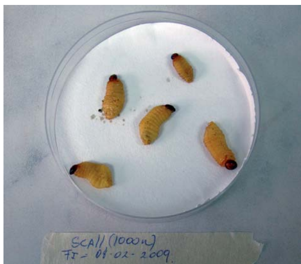
Figura 1. Coloración característica de larvas de Metamasius dimidiatipennis infestadas con nematodos entomopatógenos del género Steinernema .

Se agregó agua destilada en el fondo de la placa hasta humedecer el papel filtro para la colecta de los JI que emergían de cada larva. Las larvas muertas por nematodos se reconocían por presentar una consistencia blanda y olor no fétido. Si las larvas muertas adquieren una coloración marrón claro, la muerte es causada por especies Steinernema (Figura 1); en cambio si la coloración es rojiza, entonces es por especies Heterorhabditis (Figura 2), señalados por Aquino et al. (2006).