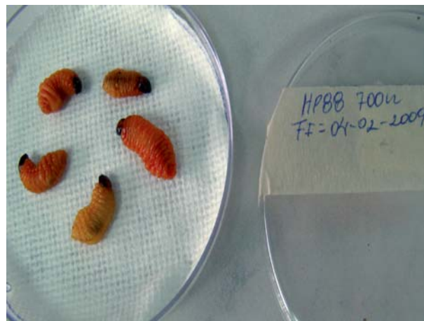
Figura 2. Coloración característica de larvas de Metamasius dimidiatipennis infestadas con nematodos entomopatógenos del género Heterorhabditis .

Se estimaron las dosis letales de las diferentes cepas de NEPs en estudio, indicando las dosis necesaria o concentración de NEPs (JI/ml), para producir 50% (DL50) o 95% (DL95) de mortalidad de larvas M. dimidiatipennis . En este proceso se utilizaron cinco concentraciones por cada cepa (100, 300, 500, 700 y 1.000 JI/ml), obteniendo la ecuación de regresión dosis mortalidad, bajo las consideraciones explicadas.