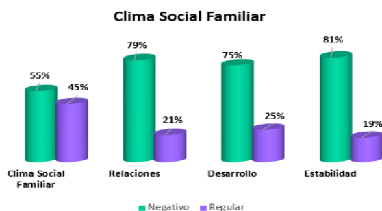
Figura 1. Variable: Clima Social Familiar y sus dimensiones

Nota: Acorde a la Figura 1, la estabilidad familiar es la más débil por lo que es necesario entablar recursos o técnicas para los integrantes de familia que los lleven a sembrar un soporte estable entre sus miembros.