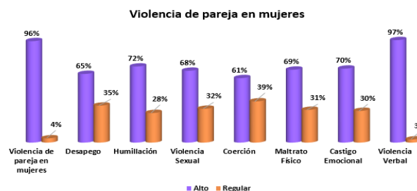
Figura 2. Variable: Violencia de pareja en mujeres y sus dimensiones

En la Figura 3, se visualiza que las mujeres que viven en el área rural son víctimas de su pareja al cincuenta y dos por ciento (52%), mientras quienes viven en el área urbana son víctimas al cuarenta y ocho por ciento (48%). En suma, se constata que existen más víctimas en el área rural que están siendo violentadas por sus parejas.