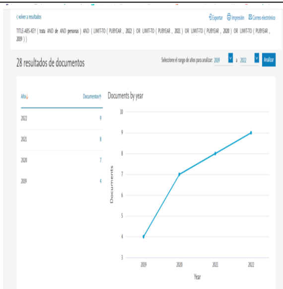
Figura 2. Metaanálisis desde el estado del arte - SCOPUS

En el contexto internacional la trata y la vulneración a derechos fundamentales se han acrecentado frente a factores exógenos que lindan con la prostitución, corrupción y diferencias sociales con discriminación, de ahí que, frente a la carencia de aplicación del paradigma de la protección integral además de la falta de efectividad, situación de que se acrecienta como consecuencia de un deficiente manejo de los organismos del Estado y preferentemente jurisdiccionales en los procedimientos judiciales evidencia notoria falta de oportunidad, diligencia debida, entre otros, las cuales generan un aislamiento depresivo de la víctima (Quiri y Pérez 2018).