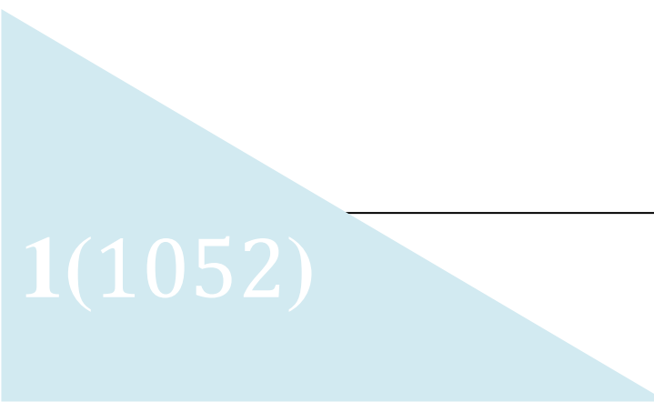
Tabla 4. Matriz F.O.D.A