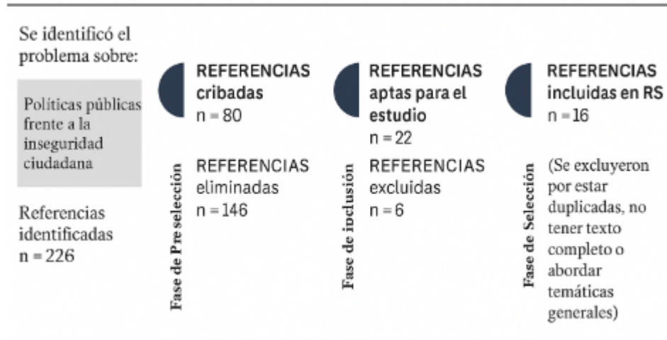
Figura 1. Proceso de recopilación de datos