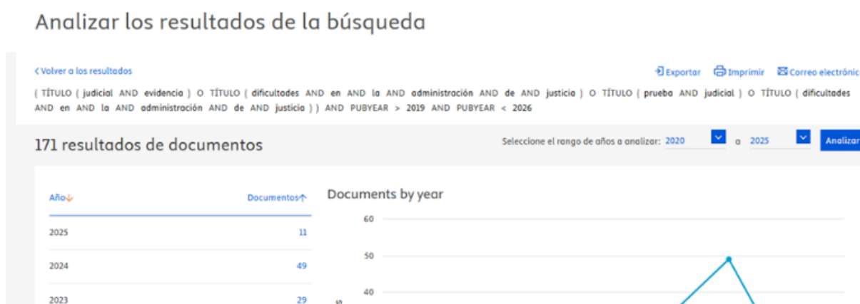
Figura 1. Análisis de los resultados

También se advirtió que el analizador de búsqueda dentro del referido periodo tiende a un ascenso, conforme se aprecia la Figura 1. Además, en la búsqueda en otras bases de datos se identificaron libros de gran valor, lo cual permitieron sustentar las definiciones en mención.