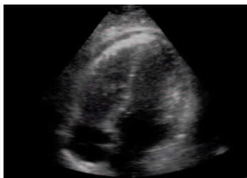
Figura 2: Ecocardiograma: Proyección apical cuatro cámaras. Pequeña línea de derrame pericárdico en cara anterior y ventrículo derecho.