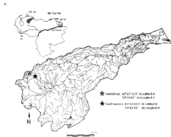
Figura 1. Área de estudio: semiárido San Francisco y sus alrededores cuenca del río Tocuyo, municipio Torres, estado Lara, Venezuela

Se seleccionaron dos áreas de muestreo con vegetación del semiárido en los alrededores de San Francisco, ambas pertenecientes a la Depresión de la subcuenca del Tocuyo Occidental (Figura 1). La primera área seleccionada se corresponde con la estación San Francisco, a 10° 16' N y 70° 18' W a una altitud de 478 msnm. La segunda área se ubica hacia el piedemonte de la Serranía de Baragua, en el sector conocido como Santa Rosa a 10° 18' N y 70° 19' W a una altitud de 570 msnm. Ambas localidades pertenecientes a la parroquia Montes de Oca, municipio Torres, estado Lara, en el Centroccidente de Venezuela.