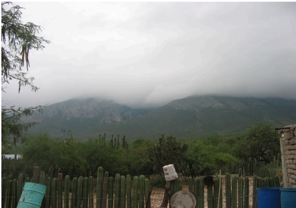
Imagen 2. Cercos vivos.

Si bien en ocho de cada diez hogares los hombres realizan las reparaciones domésticas y el mantenimiento del cerco del hogar, también participan otros miembros del hogar (ver tabla 4). Las viviendas en este tipo de localidades del semiárido mexicano norestense, tienen en promedio una superficie de 1,000 m 2 . Se conforman por la unidad habitacional; el lugar de la cocina y el fogón; los baños de fosa séptica (no hay sistema de drenaje público), y el solar, el espacio donde tienen plantas y animales. La mayoría de las casas tienen un cerco vivo hecho de los cactus llamados órganos ( Pachycereus marginatus , Lemaireocereus marginatus , imagen 2).