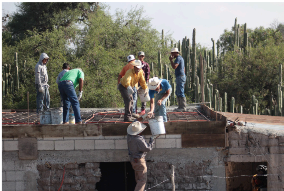
Imagen 1. Reconstrucción de cuartos: la placa de cemento del techo.

Como se pudo constatar en el trabajo de campo de 2020 y 2021, la construcción, ampliación o reparaciones mayores de la vivienda, la realizan los hombres del hogar, en ocasiones con la ayuda de la red familiar o de vecinos y amigos (ver imagen 1).