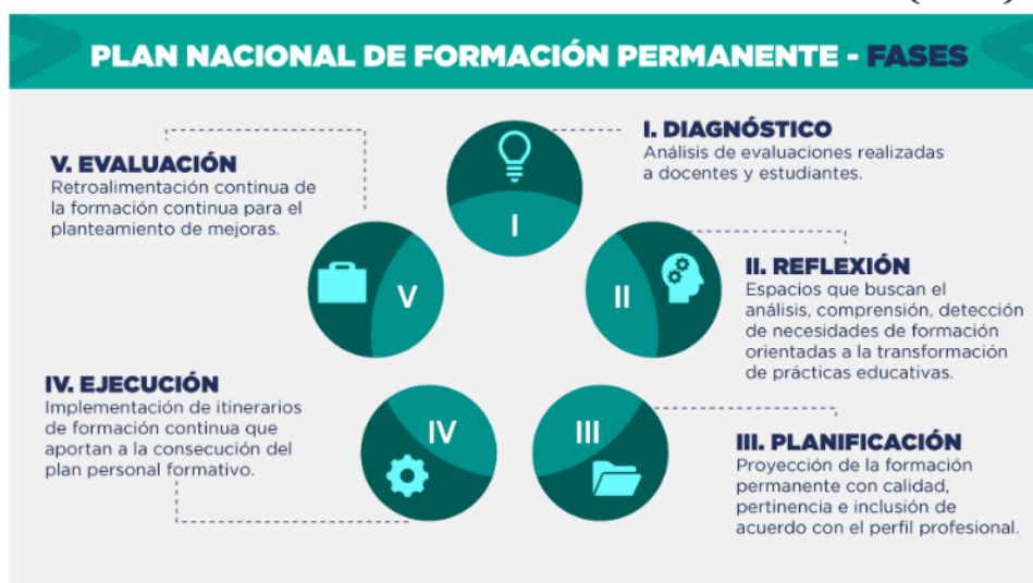
Gráfico N°2. Plan Nacional de Formación Permanente (2022)

El Ministerio de Educación del Ecuador, propuso cinco fases para la ejecución del Plan Nacional de Formación Permanente. El Plan inicia con la identificación de las necesidades de formación por medio de un diagnóstico, seguidamente se crean espacios de reflexión orientados a la transformación de las prácticas educativas. Se pasa al proceso de planificación de la formación teniendo en cuenta el perfil profesional, la ejecución del plan de formación continua relacionado con el plan de formación personal, aportando a la mejora de su perfil profesional y se finaliza con el proceso de evaluación del plan de formación para la retroalimentación y mejora continua (ver gráfico n°2).