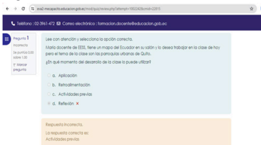
Gráfico N°3. Sistema de evaluación de la Plataforma Mecapacito

Ejemplo de la forma de evaluación de los cursos.