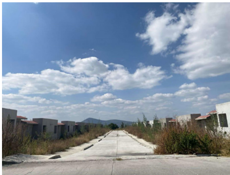
Figura 2. Parte de las viviendas sin terminar

El Nido es un conjunto urbano pequeño, en comparación con otros conjuntos del municipio, algunos de los cuales superan las 10,000 viviendas. Cabe advertir que, a más de seis años de haberse autorizado la última etapa de construcción aún no se ha completado, por lo que existen viviendas sin terminar, como se muestra en la Figura 2. Además de que 465 viviendas particulares se encuentran deshabitadas (INEGI, 2020).