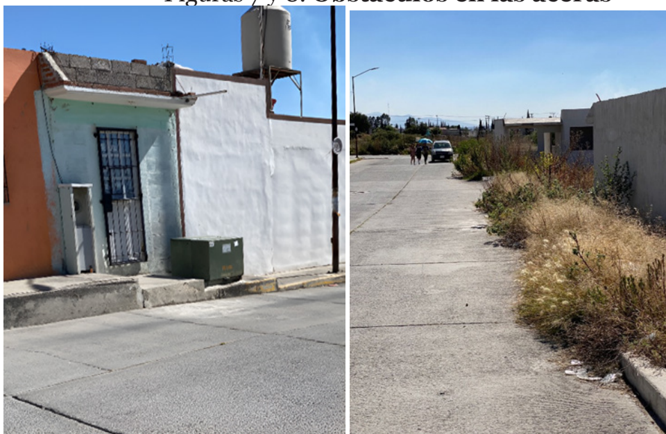
Figuras 7 y 8. Obstáculos en las aceras

Además, la falta de certeza sobre la entrega final del conjunto ha dejado áreas inconclusas. En las inmediaciones de casas no terminadas por la inmobiliaria o en viviendas deshabitadas, la proliferación de maleza contribuye a una sensación de abandono y deterioro del entorno. Ver Figuras 7 y 8.