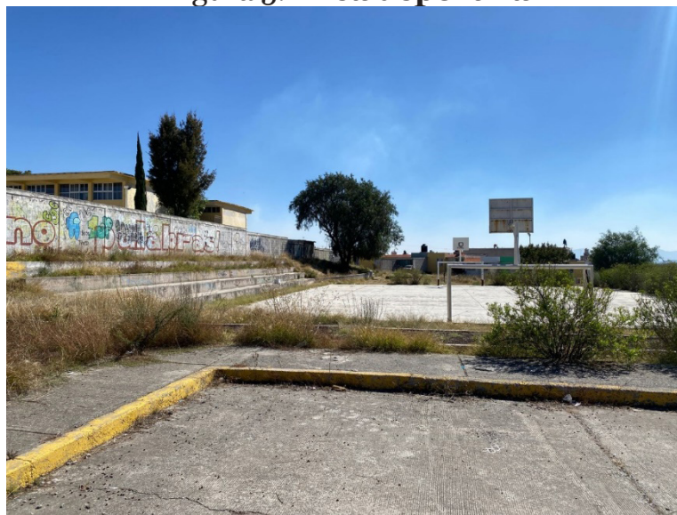
Figura 5. Área deportiva