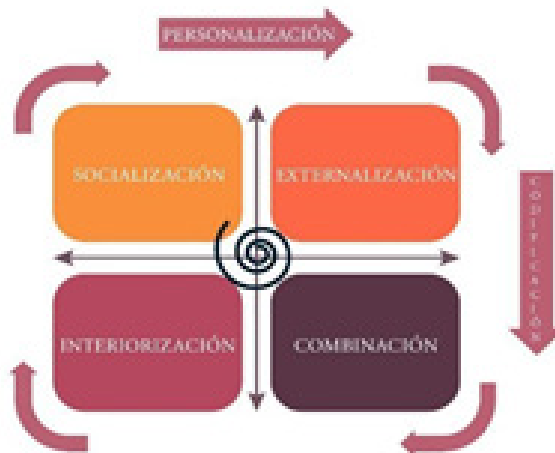
Figura 1. Estrategias de personalización y codificación y modelo SECI

Fuente. Adaptado con base a de Nonaka y Takeuchi (1995) y Hansen et al., (1999) y Joia y Lemos (2010)