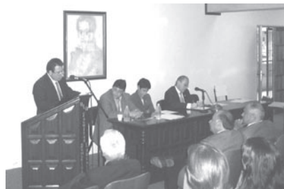
Palabras alusivas del Director de la revista Educere.

Discurso pronunciado en la Cátedra "Simón Bolívar" de la Facultad de Humanidades y Educación, el 27 de julio de 2007, con motivo de la celebración del X Aniversario de la creación de EDUCERE.