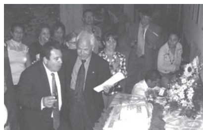
Celebración social del festejo aniversario.