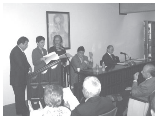
Presidium del acto protocolar.