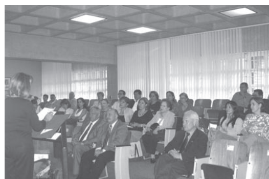
Vista parcial de los asistentes al evento aniversario.