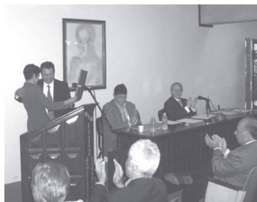
Entrega de una placa de reconocimiento institucional a EDUCERE.