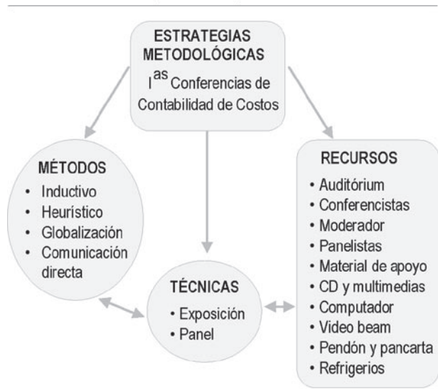
Figura 1 : 1 as Conferencias de Contabilidad de Costos como Estrategia Metodológica.

Los métodos son los caminos para llevar a cabo el proceso enseñanza-aprendizaje, es decir, son procedimientos generales basados en principios lógicos los cuales suelen ser comunes para varias ciencias y abarcan distintas técnicas (Ministerio de Educación, 1997). De acuerdo a la forma de razonamiento los métodos de enseñanza empleados fueron el inductivo y el heurístico , ambos fueron utilizados por cuanto se trató de que el alumno comprendiera algunos tópicos sobre la materia mediante la observación de un resumen esquemático y ejemplificado de casos reales particularizados del uso y aplicabilidad de la contabilidad de costos en la región andina, presentados por los conferencistas, con la finalidad de estimular la reflexión y