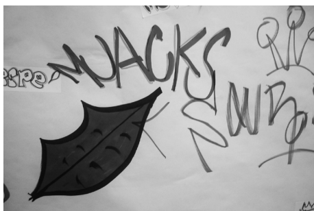
Sobre el mural, realizaban dibujos, plasmaban su firma, incorporaban mensajes a sus compañeros, etc.