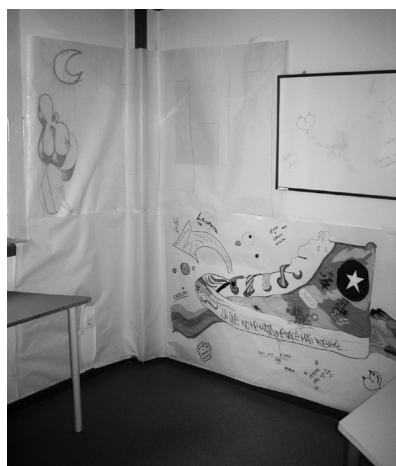
Este mural sirvió durante varias sesiones como un soporte para la comunicación de los chicos

Vista esta situación, y los usos que los chicos terminaban haciendo de estos soportes, nos planteamos la posibilidad de utilizar un soporte para la comunicación que además fuera muy cotidiano para ellos y que pudiera ser el protagonista de uno de los talleres. El soporte o vehículo elegido fue la televisión.