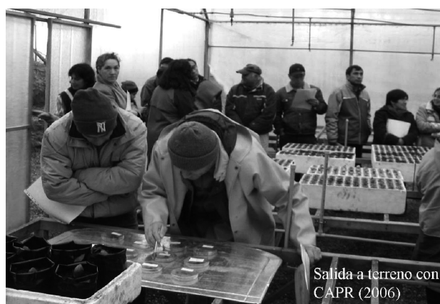
Salida a terreno, vivero Universidad Austral de Chile, Valdivia, región de Los Ríos

Además, y con el objetivo de conocer y contrastar experiencias, se invitó a dirigentes de CAPR de la región del Bio-Bio (36°00' y 38°30'), donde el abastecimiento de agua potable en algunos sectores se encuentra en riesgo debido principalmente a la deforestación y expansión de plantaciones forestales de especies exóticas de rápido crecimiento altamente consumidoras de agua, de acuerdo a lo expuesto por los propios dirigentes. Los contenidos de este taller fueron los mismos que en la primera etapa.