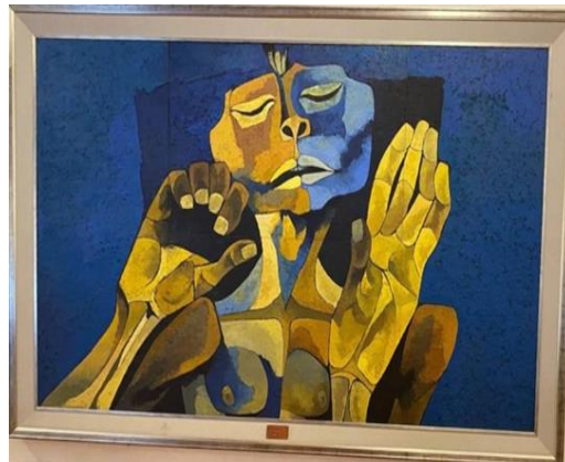
Figura 3. El mestizaje. Fuente: Guayasamín (1996).