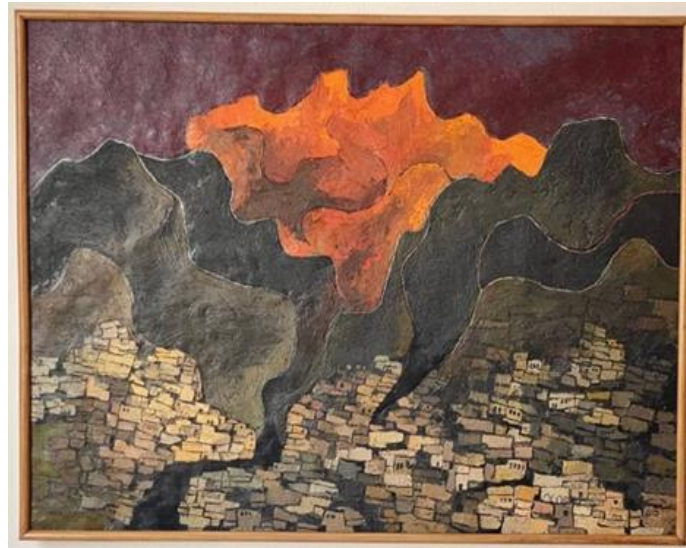
Figura 2. Quito ardiente. Fuente: Guayasimín (1995).