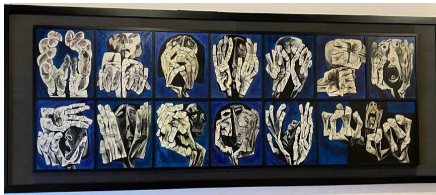
Figura 4. Las manos. Fuente: Guayasamín (1968).

El mestizaje expresa la imagen estereotipada del indígena sudamericano, a partir de rasgos físicos y psicológicos que lo identifican, idea que ha llegado a formar parte del imaginario social. Guayasamín se centra en el hombre latinoamericano, a quien rinde homenaje reconociendo la mezcla de razas y de culturas que lo caracterizan.