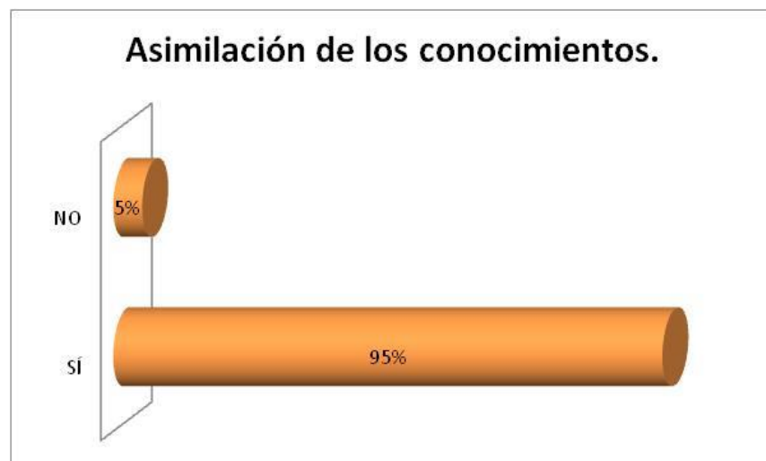
Figura 1. Asimilación de los conocimientos.

Los resultados demuestran ciertos alcances que, mediante la gamificación, surgieron como alternativas de solución a las debilidades presentadas por los estudiantes en cuanto al dominio de la geometría.