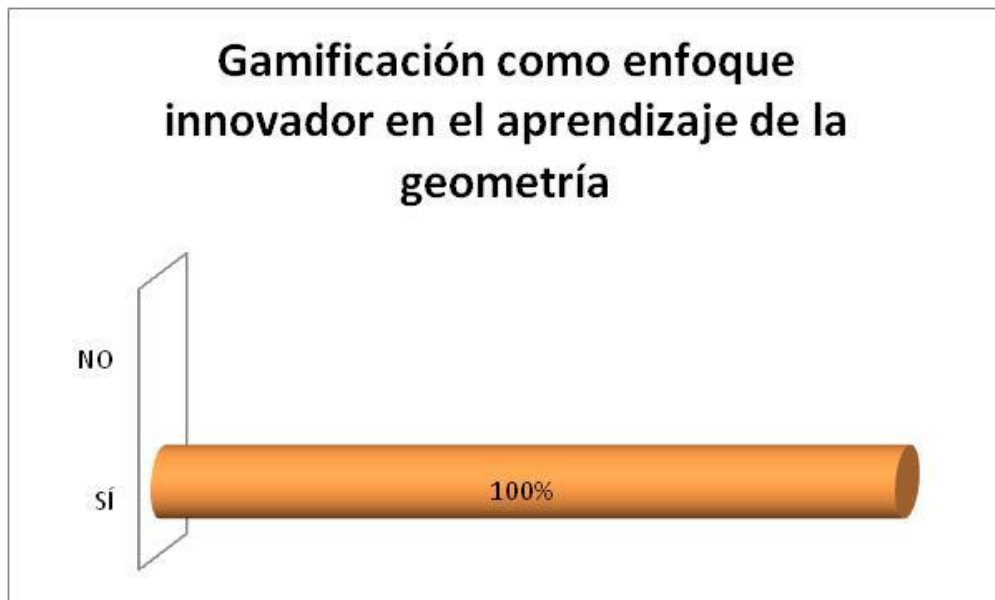
Figura 4. Gamificación como enfoque innovador en el aprendizaje de la geometría. Elaboración: Los autores.

La figura 4 demuestra que el 100% de los estudiantes universitarios perciben la gamificación como enfoque innovador en el aprendizaje de la geometría. Este resultado es cónsono con la apreciación de Encalada (2021), quien supone que la gamificación “hoy en día ha tenido gran popularidad debido a que gracias a las nuevas tecnologías se han podido desarrollar herramientas que permiten al alumnado aprender de forma entretenida y diferente a la manera tradicional” (p. 320).