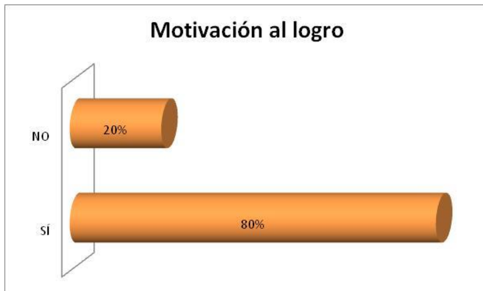
Figura 2. Motivación al logro.

resultado permite afirmar que la lúdica aplicada por los docentes generó efectos positivos en el nivel de educación superior. Acosta et al. (2022) apoya este resultado afirmando que “los componentes del juego son mecanismos aplicados que generan motivación en el jugador para realizar determinadas acciones de tal forma que ésta sea memorable” (p. 30).