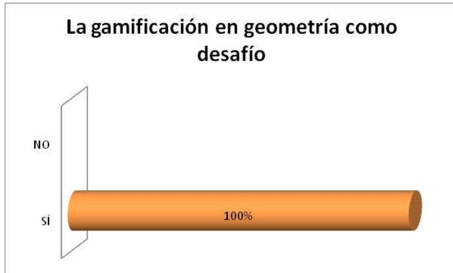
Figura 6. La gamificación en geometría como desafío.