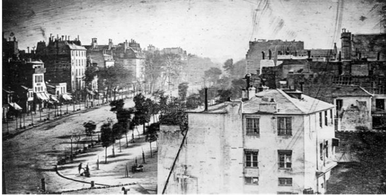
Louis Daguerre “Boulevard du Temple” (1838)

Es esencialmente por esta razón que para Agamben la visión fotográfica coincide con la visión del dios del Apocalipsis ; quien ve la vida humana, hecha de pura temporalidad, fuera del tiempo, en la eternidad. Pero en la eternidad puede precisar la hechura inequívoca y particular de una vida según sus proprias obras (τα εργα αυτων); es decir como el tiempo de la existencia de una vida, en la acción particular irrepetible, sucinta, de haber hecho lo correcto fuera de la mirada de los otros, de haber soportado la verdad de sí mismo en el propio Getsemaní interior, de haber pagado o engañado a quien pulió su calzado 3 . No se trata de la obra paradigmática, aquella que es pública, sino de la obra radical, propia, irrepetible de una vida humana en su trascurso por el tiempo de la creación, del cual ella es, sin embargo, un modo. Dios no juzga la hazaña, juzga el amor. El amor en este contexto significa la consumación de la ley (πληρωμα ουνομου η αγαπη) 4 y, por ende, la imposibilidad de la ley en el tiempo; la ley como la plenitud del amor fuera del tiempo. El amor es un pleroma , el momento de plenitud de todas las cosas en Dios; y Dios, todo en todos 5 . En otros términos, el pleroma solo puede ser pensamiento, un pensamiento totalmente subjetivado, pues se encuentra en el amor y no en la ley, como lo