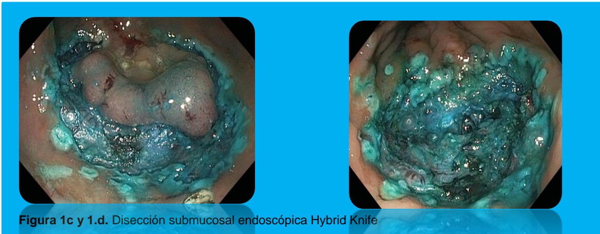
Figura 1c y 1.d. Disección submucosal endoscópica Hybrid Knife