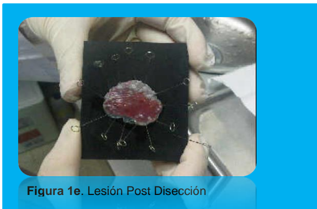
Figura 1e. Lesión Post Disección