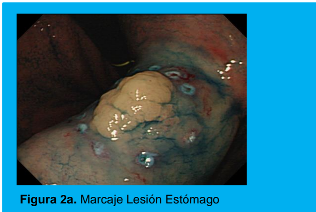
Figura 2a. Marcaje Lesión Estómago