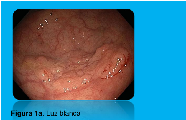
Figura 1a. Luz blanca

La resección en bloque y márgenes libres de lesión se obtuvieron en todos los casos. El tamaño de la mucosa disecada fue entre 2-7 cms (X=3,8 cms). El tiempo endoscópico fue entre 45-120 minutos (X=84,4 minutos) (Figuras 1 y 2).