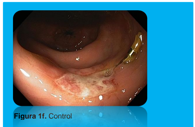
Figura 1f. Control