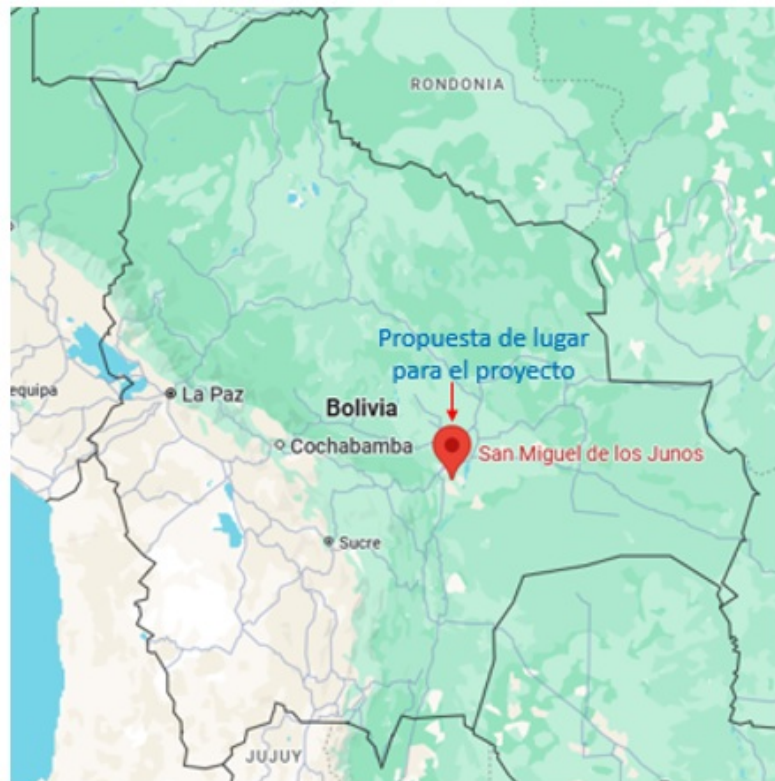
Fig. 1. Mapa de geolocalización del área de estudio.

En la Figura 1, se muestra la ubicación de San Miguel de los Junos, lugar en el cual se podría desarrollar una planta bajo el criterio propuesto en esta investigación.