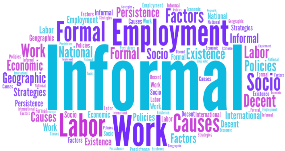
Figura 1. Palabras claves de búsqueda para la revisión. Elaboración: Los autores.

Los resultados además arrojaron las palabras claves siguientes: