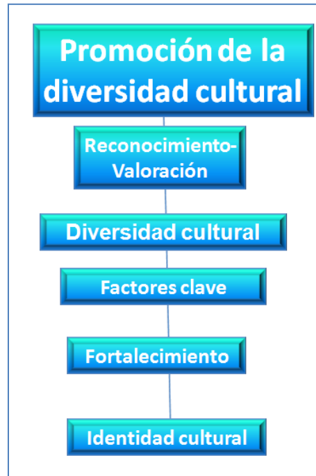
Figura 4. Promoción de la diversidad cultural.