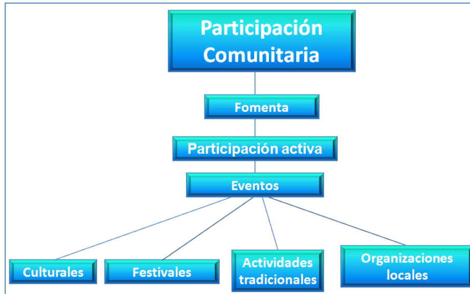
Figura 2. Participación comunitaria. Elaboración: Los autores.

Escobal Saona-Elman; Kony Luby Duran-Llano