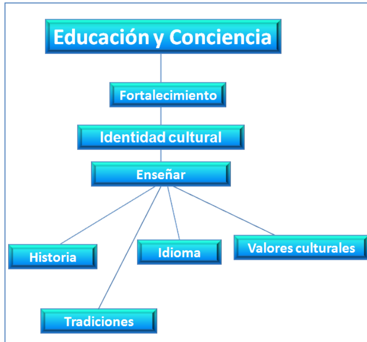
Figura 1. Educación y conciencia.