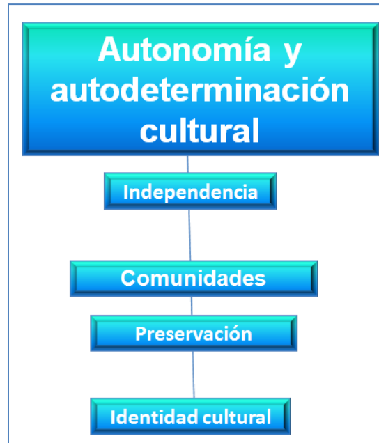
Figura 5. Autonomía y autodeterminación cultural. Elaboración: Los autores.

Escobal Saona-Elman; Kony Luby Duran-Llano