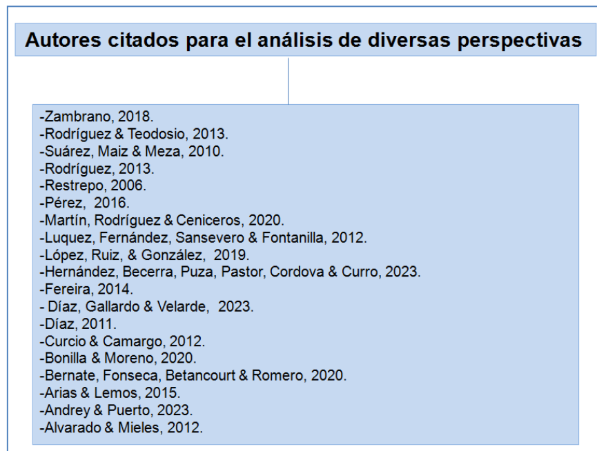
Figura 2. Autores citados para en análisis de diversas perspectivas.

La figura 1 señala los aspectos que emergieron de la revisión, resaltando los factores principales que han contribuido a la constitución de una ciudadanía fundada en la armonía, la paz y la felicidad.