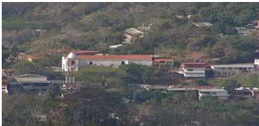
Figura 1. Vista panorámica del pueblo de Paracotos

Paracotos: su transformación socio- económica y cultural en tiempo y espacio. Una propuesta pedagógica para seguir tejiendo su historia.