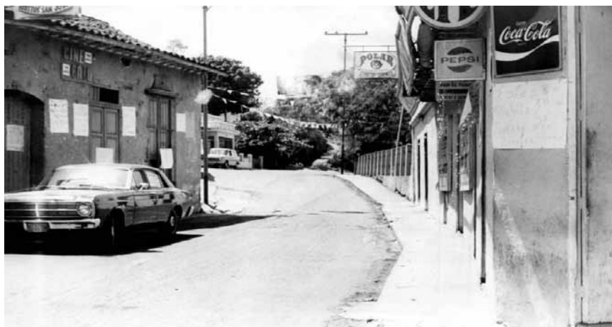
Figura 3. Una mirada de nostalgia a la entrada del pueblo

de estas, se da origen a las encomiendas. Paracotos no escapa de este fenómeno, donde los aborígenes son sometidos a condiciones de trabajo infrahumanas. La entrega de nativos en encomienda a Francisco Tostado de la Peña, el día 8 de abril de 1.600, dotación hecha por Diego Vásquez de Escobedo, Gobernador interino de la Provincia, fue un pago por haber este colaborado con la caza y posterior sacrificio del patriarca Guaicaipuro (p. 142).