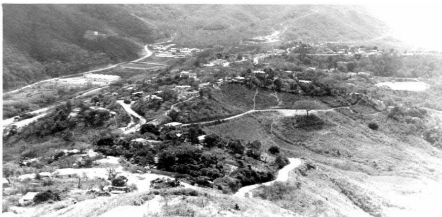
Figura 2. El pueblo contemplado desde El topo de la Cruz. Fotografía de principios del siglo XX

Sobre los orígenes de la fundación de Paracotos existen diversas versiones, en las que varios autores relatan el origen del poblado, no todas son fidedignas, pero si necesarias a la hora de reconstruir su historia, pues se debe tomar en cuenta, la poca información que se tiene sobre la localidad.