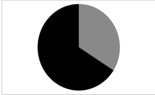
Gráfico 1. Revistas que detallan artículos

Como se evidencia en el gráfico anterior, de las nueve revistas, seis (parte más oscura) dan detalles acerca de los artículos mientras que tres (parte más clara) no lo hacen.