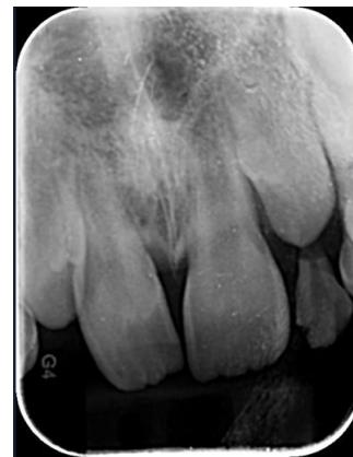
Figura 8. Control, pos erupción de Incisivos centrales superiores