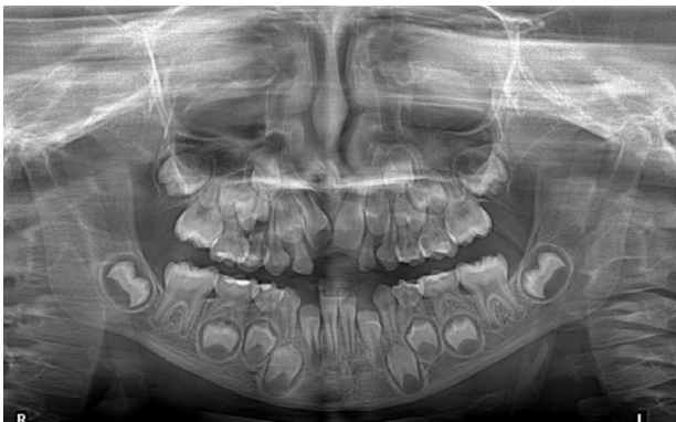
Figura 6. Control radiográfico a los tres meses. Radiografía panorámica.