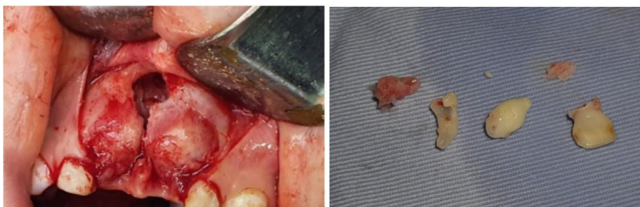
Figura 5. Colgajo trapezoidal vestibular - Dientes supernumerarios extraídos