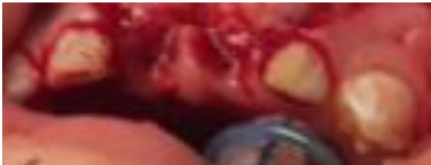
Figura 4. Exodoncia de los dientes temporales 5.1 y 6.1

Posteriormente, la técnica de anestesia infraorbitaria e infiltración de piso de fosas nasales extra oralmente del lado derecho y a nivel de espina nasal lograron un bloqueo de la zona; con un bisturí número 15 se realizó una incisión, con colgajo trapezoidal vestibular exponiendo el piso de la fosa nasal. Posteriormente al liberar la membrana del piso de la fosa nasal, se observó la corona del mesiodens incluido, se realizó osteotomía alrededor de la corona y odontosección, seguidamente con elevador recto apical se efectuó la extracción, primero de la corona dental y después la porción radicular. Luego se procede a realizar una nueva incisión, con un bisturí número 15, logrando un colgajo palatino gingival, con el cual se observa la corona del diente supernumerario incluido, realizando una osteotomía alrededor de la corona, luego con elevador recto apical se efectúa la extracción (Figura 5)