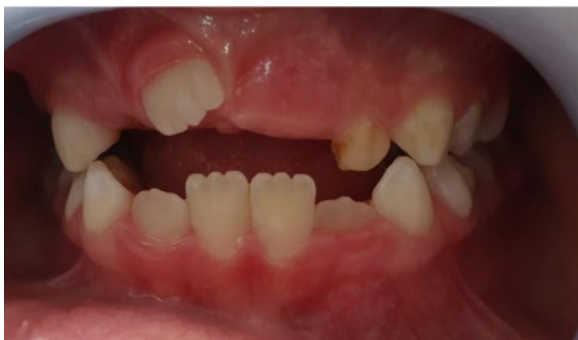
Figura 7. Control clínico a los tres meses