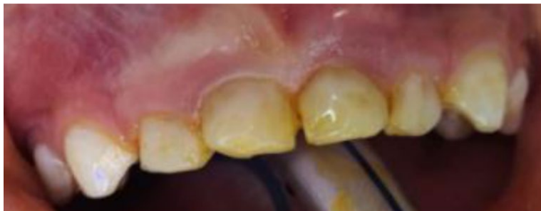
Figura 1. Aspecto inicial de la cavidad oral

Paciente de 6 años y 11 meses de edad, con diagnóstico sistémico aparentemente sano, acude a control odontológico, al realizar el examen clínico intraoral se observa múltiples lesiones cariosas. Al realizar la radiografía panorámica de control, se observó la presencia de mesiodens, (Figura 1). Para lograr una localización exacta ya que en la radiografía panorámica, se logra observar al diente supernumerario 1 entre las coronas de los incisivos centrales superiores y al diente supernumerario 2 sobreproyectada en la corona del incisivo central superior izquierdo, por lo cual se requiere un estudio radiográfico completo como es la tomografía computarizada de haz cónico (TCHC) (Figuras 2 y 3 ), en la cual se pudo observar la presencia y ubicación exacta de las dientes supernumerarios. El primer diente supernumerario (mesiodens), se presentaba