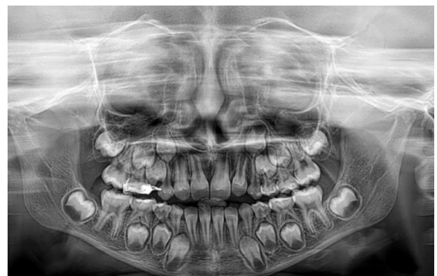
Figura 9. Control radiográfico final. Radiografía panorámica.