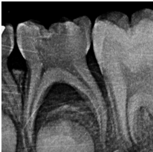
Figura 2. Radiografía periapical del segundo molar inferior izquierdo primario (75). Marzo 2021.

extensión hasta la cámara pulpar, asociada a lesión en la región de furca, aumento del espacio del ligamento periodontal en mesial y disminución de altura ósea en distal (Figura 2).