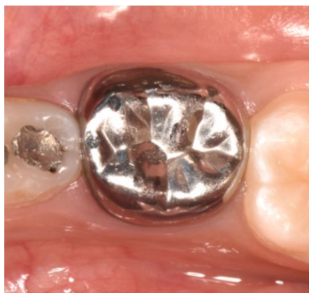
Figura 4. Seguimiento clínico a los 8 meses de tratamiento. Noviembre 2021.

con hueso alveolar, adecuado espacio del ligamento periodontal y altura ósea en mesial y distal (Figura 4 y Figura 5).