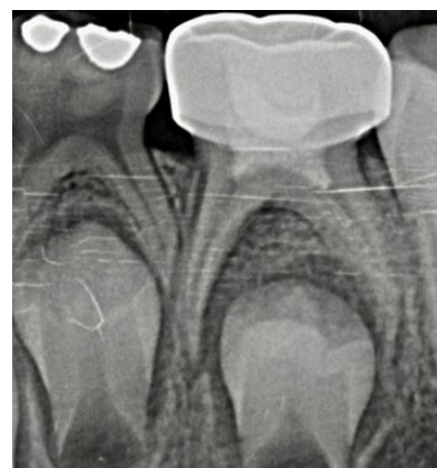
Figura 5. Seguimiento radiográfico a los 8 meses de tratamiento. Noviembre 2021.