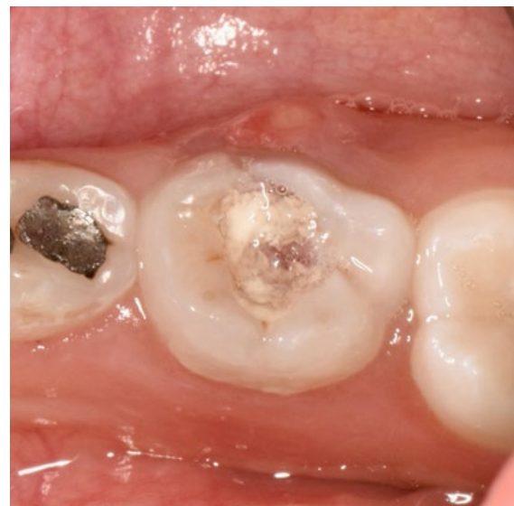
Figura 1. Aspecto clínico de segundo molar inferior izquierdo primario con lesión de caries activa y cavitada y absceso periodontal agudo. Marzo 2021.

En la radiografía periapical se observó imagen radiolúcida localizada en la corona con