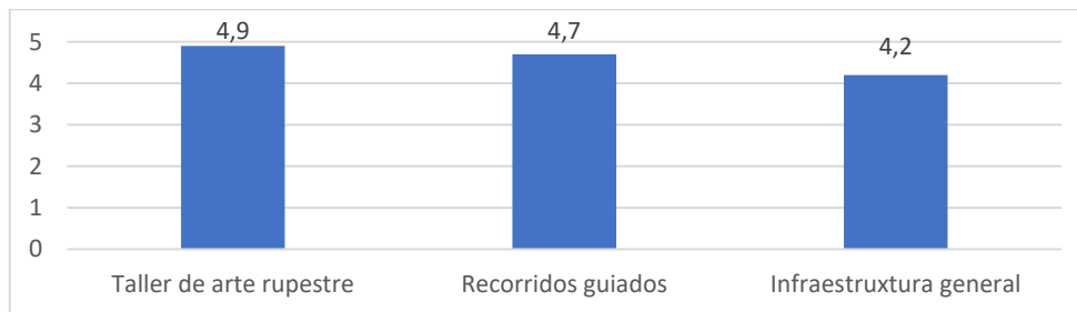
Gráfico 2. Percepción de los Visitantes sobre las Actividades del AgroParque.

La tabla 4 presentó promedios aritméticos: taller de arte rupestre ( \Sigma respuestas = 294 / 60 = 4,9), recorridos ( \Sigma = 282 / 60 = 4,7 ), infraestructura ( \Sigma = 252 / 60 = 4,2 ). Las desviaciones estándar bajas (0,3 y 0,4 para actividades interactivas) indicaron homogeneidad en las valoraciones positivas, contrastando con la mayor dispersión en infraestructura (0,6), lo que sugirió consistencia en la apreciación de experiencias prácticas, pero variabilidad en percepciones sobre aspectos logísticos, destacando prioridades para mejoras futuras.