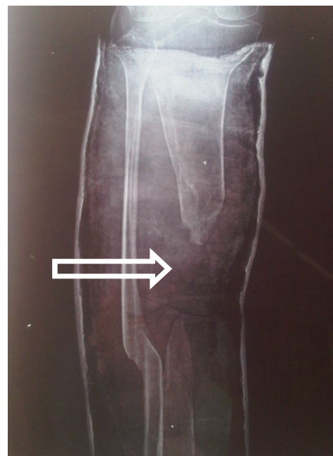
Figura 1. Rx Ap de tibia. Flecha Defecto óseo de 1/3 medio con proximal de tibia con angulación del fragmento proximal y pseudoartrosis en punta de tibia en ambos extremos.

El paciente acude a nuestra consulta en Centro Clínico la Isabelica en febrero de 2012, al examen físico se evidencia deformidad de pierna derecha en recurvatum de 30 grados, hundimiento por defecto óseo de 1/3 medio de tibia derecha, no se encontró lesiones nerviosas periféricas, debilidad muscular II/V con respecto a su lado contralateral, trastornos tróficos en piel sin úlceras o fistulas activas, acortamiento de 8 cm en miembro inferior derecho sin inmovilización y se solicitó radiología (Rx) Anteroposterior (Ap) y lateral de pierna derecha, evidenciándose defecto óseo extenso por pérdida de aproximadamente 10 cm de 1/3 medio con proximal de tibia (Figura 1).