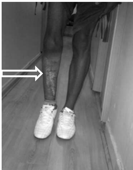
Figura 3. Flecha Miembro inferior derecho sin tutor externo en tibia. Se aprecia acortamiento de 7 cm de longitud con respecto a su miembro contralateral. Paciente en postoperatorio de 8 meses.

se apreció evidencias radiológicas o clínicas de reaparición de osteomielitis en tibia derecha, a los 8 meses de la cirugía se realizó retiro del tutor externo y el paciente se encuentra deambulando con muletas con un acortamiento residual de 7 cm, lo cual se compensa con uso de alza de miembro inferior derecho en el calzado (Figura 3).