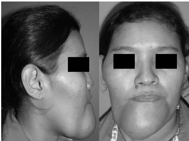
Figura 1. Frente y perfil: Pre-operatorio. Se observa aumento de volumen en tercio medio inferior, haciendo énfasis en zona mandibular, maxilar y cigomática derecha

Paciente femenino de 45 años de edad quien acude a consulta por presentar aumento de volumen en la región facial de aproximadamente 20 años de evolución. A la exploración física se observa asimetría facial caracterizada por aumento de volumen en región mandibular, maxilar y cigomática derecha (figura 1). Actualmente acude refiriendo aumento de volumen progresivo asintomático en el tercio facial medio e inferior de predominio derecho, sin antecedentes sistémicos de importancia para el padecimiento actual, a la exploración física, observamos un cráneo normocefalico sin exostosis ni hundimientos, globos oculares simétricos con pupilas isocóricas y normoreflexicas a estímulos luminosos, aumento de tercio facial medio de predominio derecho, con desviación nasal a la izquierda, tercio facial inferior con aumento de volumen en región mentoniana y desviación mandibular a la derecha presentando tumor en región submandibular y submentoniano, perfil cóncavo, aumento de la distancia cervicomenta, sin adenomegalias, intraoralmente se observa aumento de volumen en piso de boca, reborde alveolar anterior y lateral derecho, de consistencia dura, mucosa adyacente de color y características normales.