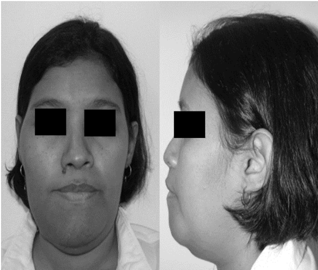
Figura 4. Imágenes postoperatorias. Observando la mejoría del aumento de volumen que presentaba la paciente, logrando una mejor funcionalidad y mejor calidad de vida. Julio 2009.

y toma de muestra de la zona hasta obtener adecuado contorno, se sutura por planos, se verifica hemostasia y se coloca cura compresiva, seguidamente se procede a realizar abordaje circunvestibular maxilar derecho se levanta colgajo mucopériorio y se expone zona de displasia en región cigomático maxilar derecha, se realiza remodelación ósea y toma de muestra de la zona hasta lograr adecuado contorno, se sutura por planos y se verifica hemostasia, y se termina el procedimiento sin complicaciones. Se envía especímenes para estudios histopatológicos reportando hueso inmaduro en el seno de un estroma fibrocelular en el cual se pueden encontrar osteoclastos dispersos, trabeculado delgado e irregular, no estando conectados unos con otros mostrando morfología curvilínea (patrón de letras chinas). Se solicita interconsulta con endocrinología quienes descartan compromiso sistémico del padecimiento. Se realiza seguimiento a la paciente durante 5 años observando evolución satisfactoria y adecuada estética. (figura 4), (figura 5).