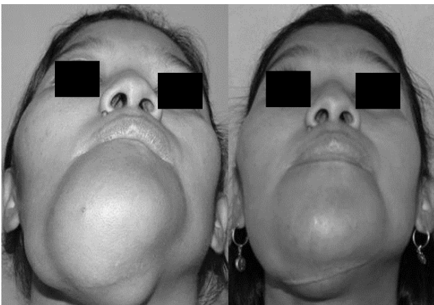
Figura 5. Pre y postoperatoria submentovertex. Imagen comparativa donde podemos observar la disminución en el aumento de volumen en zona mandibular dando una mejor calidad de vida al paciente.