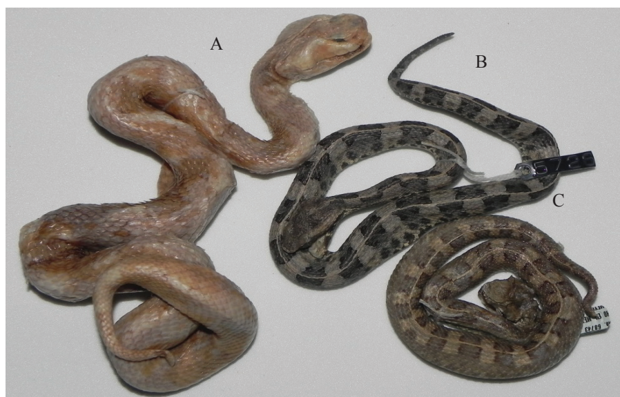
Figura 2. Morfotipos principales en el oriente de Venezuela: A: xántico (EBRG 5081). B y C: parduzco con manchas (EBRG 5728 y EBRG 4339 respectivamente).

de las regiones aledañas al macizo del Turimiquire en la carretera nacional San Miguel-Caigua. En cambio, entre las localidades de Casanay ( 10^{\circ}52'69,96''N y 63^{\circ}41'66,7''W ) y Carúpano ( 10^{\circ}67'10,6''N y 63^{\circ}26'76,8''W ), se han observado ejemplares con la coloración xántica, al igual que otras poblaciones detectadas hacia la vertiente lacustre de la Cordillera de Mérida (com. pers. Luis Felipe Esqueda) (Fig.3).