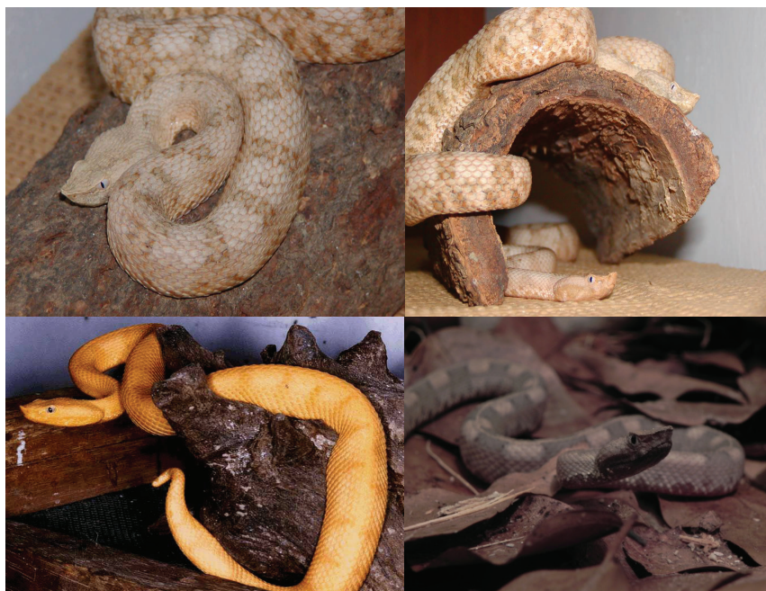
Figura 3. Patrón xántico observado entre Casanay y Carúpano, estado Sucre. Usualmente el patrón está asociado a la ausencia de manchas, sin embargo, se pueden conseguir intermedios donde las manchas son menos acentuadas o poco conspicuas.