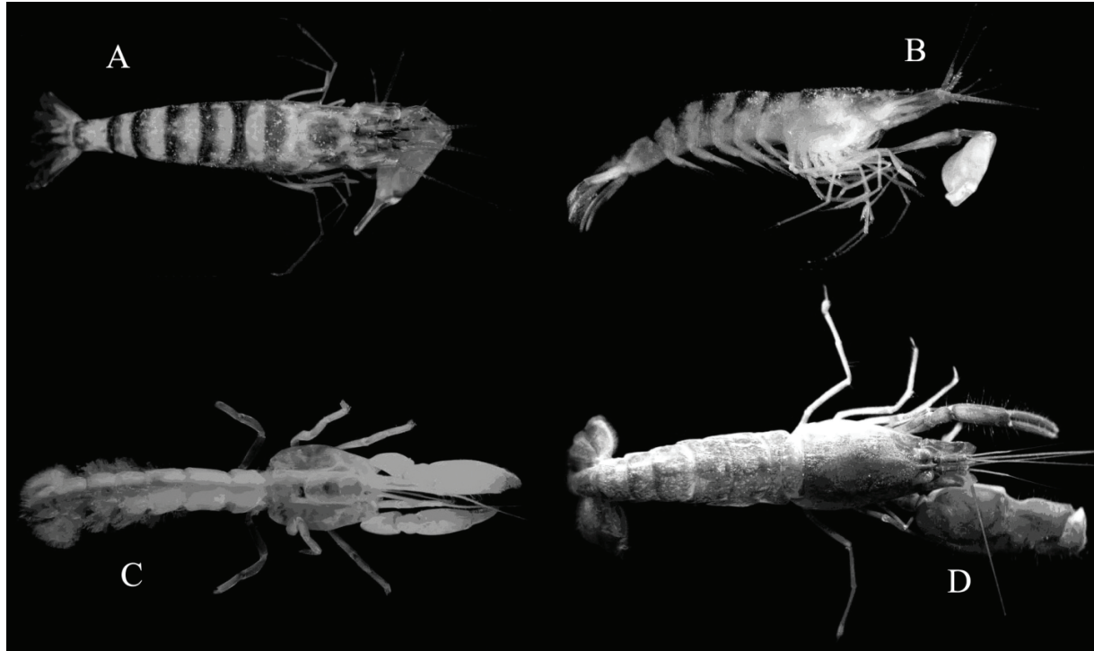
Figura 2. Salmones carvachoi vista dorsal (A), S. carvachoi vista lateral (B), Axianassa sp. (C), Alpheus estuariensis (D). Sin escalas.

relativamente amplias en el margen posterior de cada somito abdominal; pedúnculos antenulares de color azul oscuro con cromatóforos de color vinotinto; flagelos antenal y antenular rojizos; quela mayor de color blanco con tinte azulado; telson y urópodos con cromatóforos azul-violáceos dispersos.