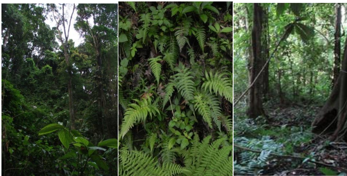
Figura 2. Detalles de la vegetación hallada en la localidad Cerro Cachipal, Península de Paria, estado Sucre, Venezuela.

En términos generales la lepidosis se corresponde con otros datos documentados de la especie a lo largo de su distribución (cf. Dixon y Soini 1977, Chippaux 1986, Pérez-Santos y Moreno et al. 1988, Cunha y Nascimento 1993, Murphy 1997, Barrio-Amorós et al. 1998) (Tabla 1). Es muy probable que su área de distribución no se restrinja a las entidades territoriales previamente documentadas sino que ocurra en otros estados que conforman el arco suroriental del país, pudiendo en el futuro esperarse una distribución más amplia que incluye las zonas más prístinas del estado Bolívar y el Delta Amacuro por la Sierra de Imataca, pasando por el macizo del Turimiquire (estados Anzoátegui, Sucre y Monagas) hasta la Península de Paria (Fig. 3), pero tal asunción requiere de confirmación. No existen datos sobre la densidad poblacional, pero es una especie extremadamente complicada de hallar, lo que coincide con lo mencionado por Murphy (1997). A pesar de tener un rango de distribución bastante amplio, es posible que la especie ocurra en densidades discretas al menos en el tramo oriental de Venezuela.