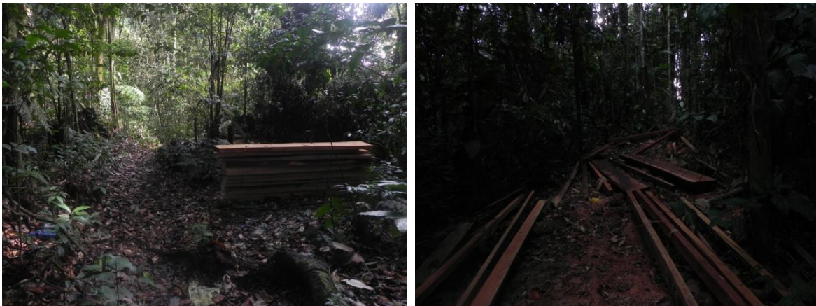
Figura 4: Extracción de madera en el Cerro Cachipal.