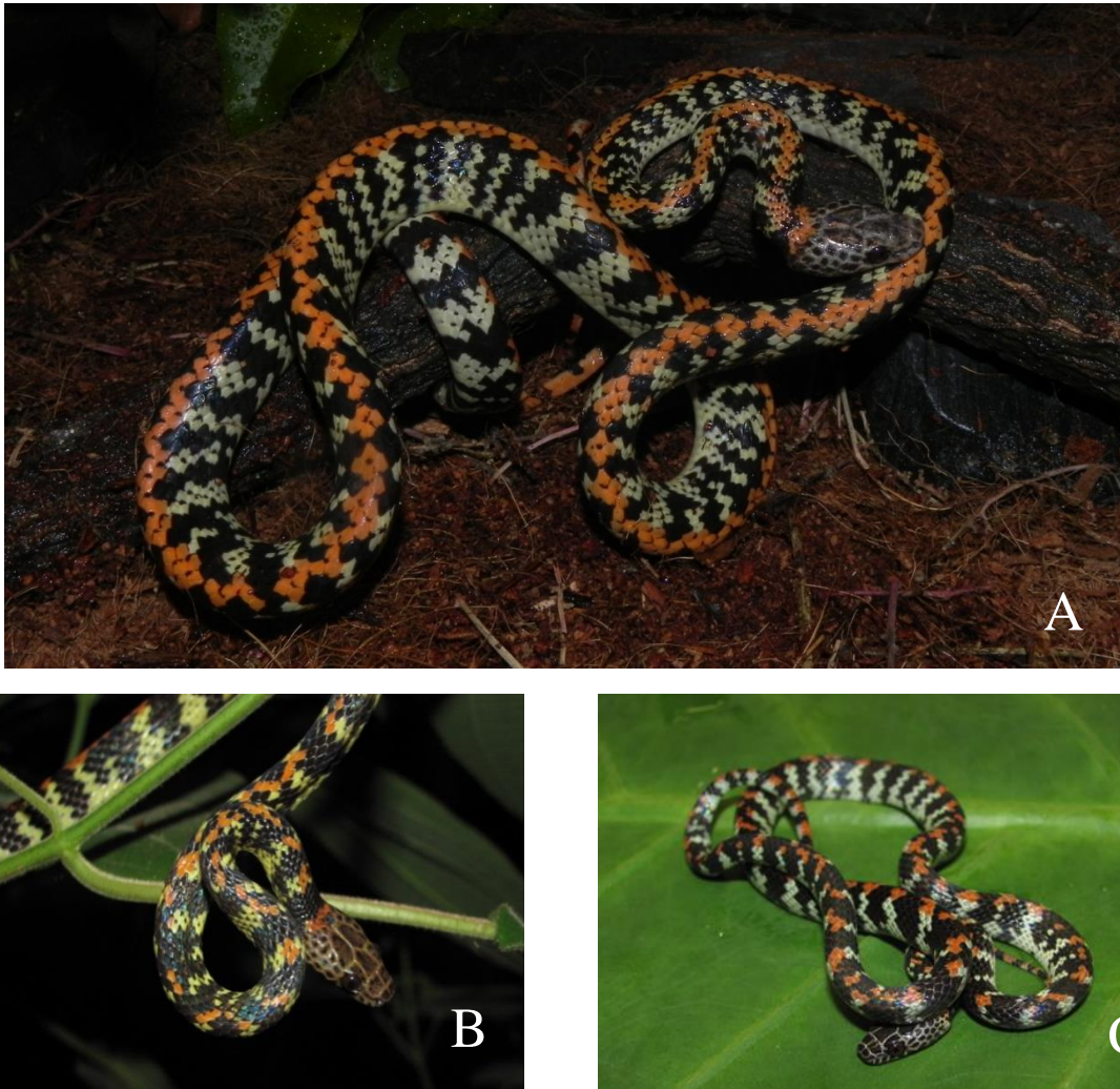
Figura 1. Ejemplar de Siphlophis cervinus recolectado en el Cerro Cachipal (A) versus ejemplares brasileños (B) y (C).

Asplenium serra , Elaphoglossum lingua , Hymenophyllum polyanthos , Nephrolepis biserrata , Oleandra articulata , Olfersia cervina y Polypodium loriceum (véase Ataroff y García-Núñez 2013). Desde el punto de vista fitogeográfico los sistemas montañosos de la Península de Paria y el Macizo de Turimiquire presentan una estrecha relación con la región de Guayana, de manera singular también ocurre con algunos grupos de mamíferos y reptiles (cf. Steyermark 1974, Bisbal 1998, Sánchez et al. 2004, Manzanilla y Sánchez 2005, Manzanilla et al. 2006, Marín 2010, Velásquez et al. 2012, Marín-Espinoza et al. 2014), siendo este género de falsas corales un claro ejemplo de esta relación. Otras serpientes con similar patrón biogeográfico podemos mencionar a Lachesis muta , Epicrates cenchria , Clelia clelia , Pseudoboa coronata , Chironius scurrulus y Spilotes sulphureus , entre otras.