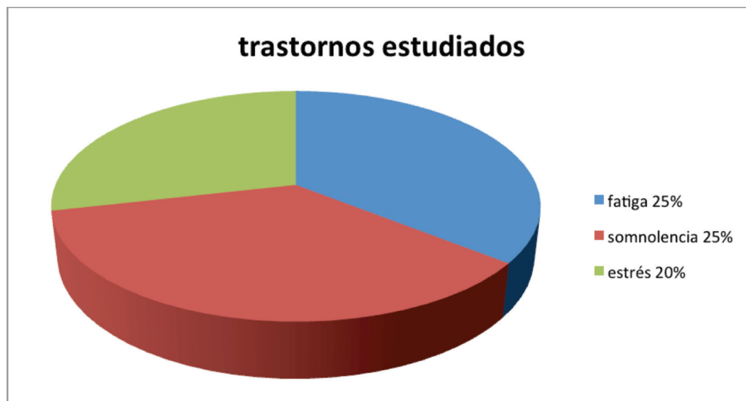
Figura N° 2. Distribución de la muestra según la presencia de los trastornos estudiados