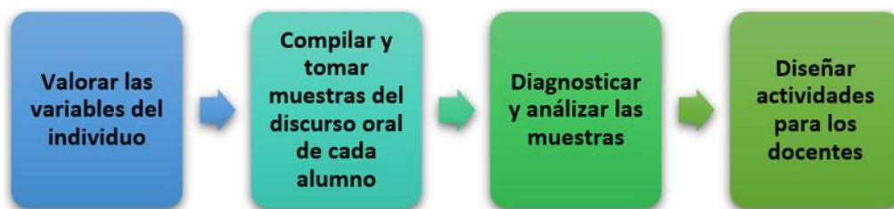
Figura 2. Fases de la pronunciación.

La pronunciación corresponde a la música de lenguaje, es decir, a la manera en que la voz sube y baja mientras el sujeto habla. Así también, la pronunciación implica un elemento clave para el logro exitoso de un discurso oral, por lo que esta habilidad de comunicación es para muchos alumnos una de las más complejas. Aunado a ello, autoras como Nieves y Remedio [13] manifiestan que la enseñanza de la pronunciación debe ir enfocada hacia las necesidades específicas de cada estudiante, es decir, poner en práctica un proceso personalológico, aspecto que hoy en día en las aulas no se aplica. Por su parte, Ellis [14] se afirma que no todos los alumnos tienen la capacidad de entender la información fónica de la misma forma, para luego reproducirla, por ello, considera que la enseñanza de la pronunciación debe pasar por las fases descritas en la figura 2.