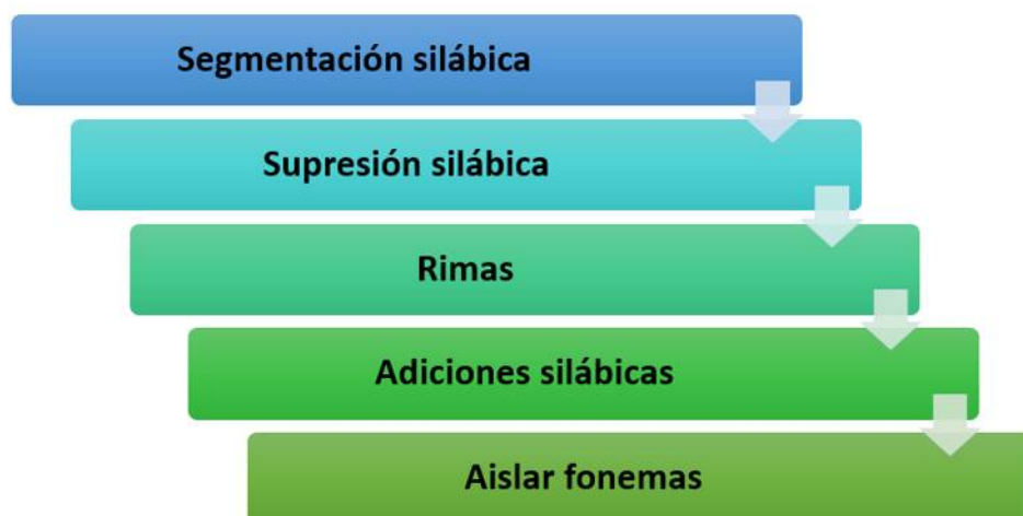
Figura 1. Elementos de la conciencia fonológica.

De acuerdo con Ojeda [12] es fundamental que se tome en cuenta cada elemento (figura 1) ya que son clave para el desarrollo de la pronunciación de los niños: