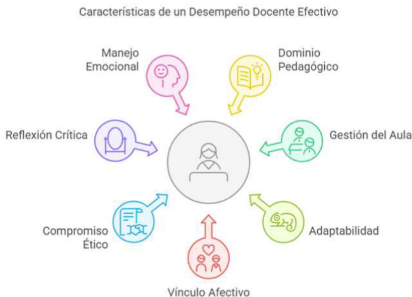
Fig. 1. Elementos que componen un apropiado desempeño docente [8], [9].